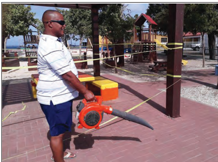
Din Domacassé ta hasiendo su parti den Parke Tului.

Tur djadumingu mainta, miembronan di direktiva ta presente den e parke pa hasi trabou di limpiesa i mantenshon.